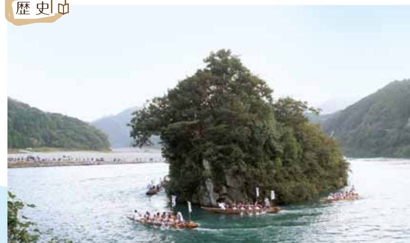
熊野速玉大社境内の一部

1 御船島 TEL 0735-33-0334 御船島は熊野川河口にある熊野速玉大社の境内の一部で、速玉神の遷座地とされており、世界遺産に登録されている。