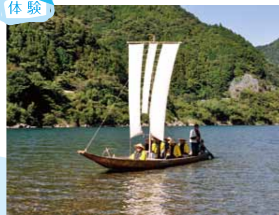
川の参詣道「熊野川」を全身で味わう

2 熊野川体感塾・三反帆 帆布を加工した3枚の帆を5mほどの帆柱に掲げ風をとらえて熊野川を下ります。水の流れる音や鳥が羽ばたく音を聞きながら、自然と一体化し、ゆっくりと優雅に熊野川を楽しむことができます。