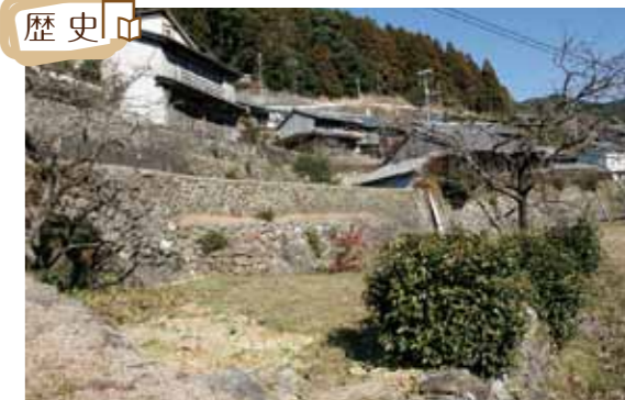
「にほんの里100選」に選ばれた川の郷

8 浅里郷 TEL 0735-33-0334 川が生活道だった山里として、「にほんの里100選」に選定された熊野川沿いの集落。山の斜面に約50戸の家々が石垣を築いて身を寄せ合う。