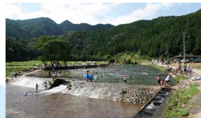
川の水をせき止めて作った自然プール

された紀宝町では、安心してウミガメが産卵できる海岸を守るためにウミガメ保護監視員が、パトロールを実施しています。絶滅の危険のある野生生物(希少種)としてレッドデータブックに掲載されたウミガメの保護にみなさんも協力してください。